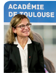
Anne Bisagni-Faure, rectrice de l'académie de Toulouse, chancelière des Universités